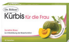
Dr. Böhm® Kürbis für die Frau - für die sensible Blase