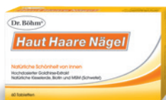
Dr. Böhm® Haut, Haare, Nägel - für schöne Haut, volles Haar, feste Nägel