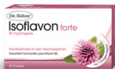
Dr. Böhm® Isoflavon 90 mg forte - Wohlfühlen in den Wechseljahren

Mehr Information zum umfangreichen Produktsortiment von Dr. Böhm® für die ganze Familie finden Sie auf www.dr-boehm.at